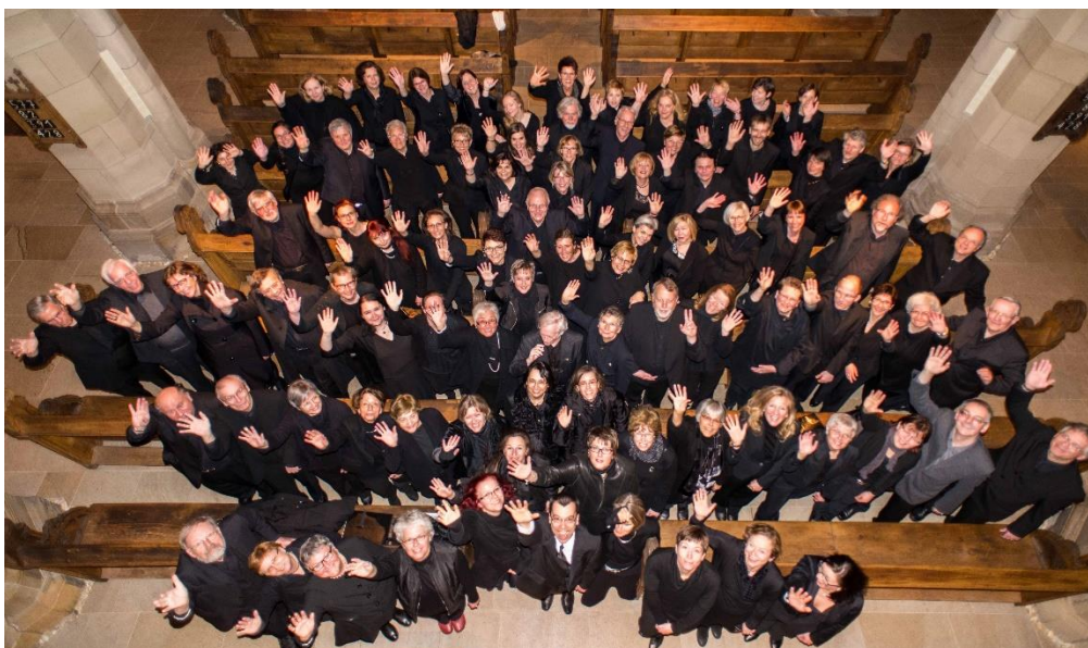
Fotos: Anja Lerch (Foto Arnd Dripte), Klangkraft Orchester (Foto Andreas H. M. Martin), Rudi Gall (Foto Markus Malangeri), Orlandos Erben (Foto Orlandos Erben), Salvatorkantorei (Foto Michael Hüter)