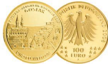
UNESCO Welterbe Goslar (2008)