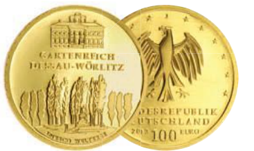
UNESCO Welterbe Gartenreich Dessau-Wörlitz (2013)