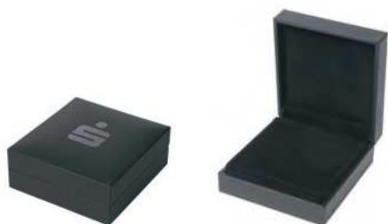
Etui mit Sparkassen-Logo (Schwarz)

Ob als Geschenk, zur Aufbewahrung oder zum Präsentieren, wir haben die ideale Verpackung für Ihre Barren und Münzen (bei Barren ab 50g nicht geeignet).