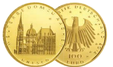
UNESCO Welterbe Dom zu Aachen (2012)