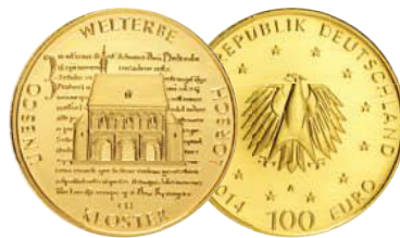
UNESCO Welterbe Kloster Lorsch (2014)