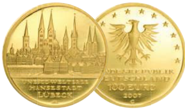
UNESCO Welterbe Hansestadt Lübeck (2007)