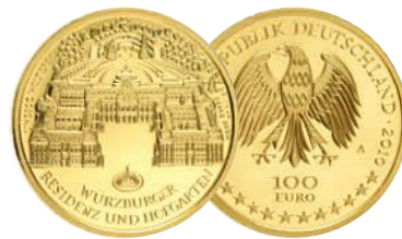
UNESCO Welterbe Würzburger Residenz und Hofgarten (2010)