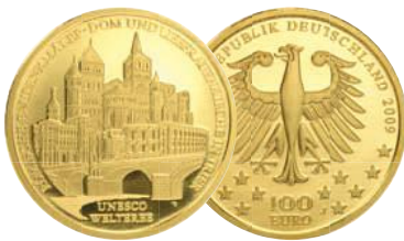
UNESCO Welterbe Römische Baudenkmäler, Dom und Liebfrauenkirche in Trier (2009)