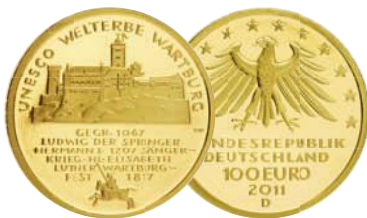
UNESCO Welterbe Wartburg (2011)